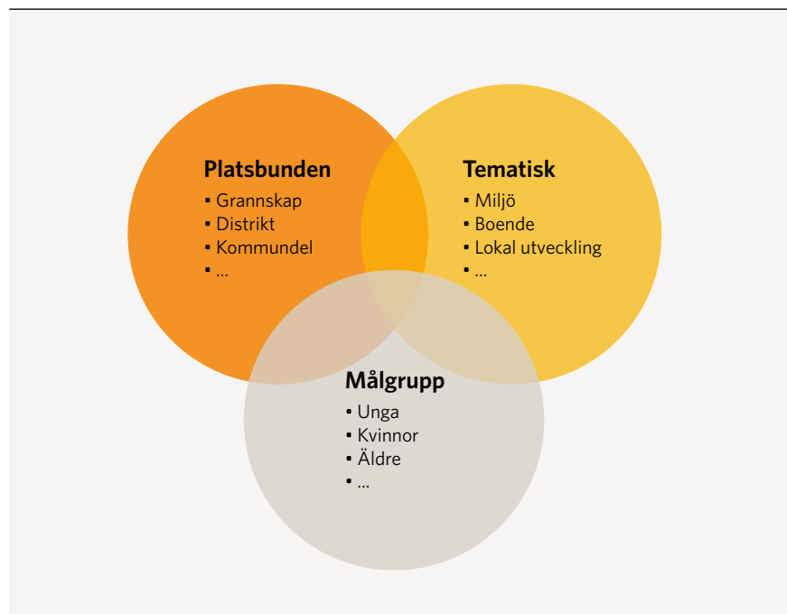
FIGUR 1. Medborgarbudgets tre inriktningar

Yves Cabannes visar att utvecklingen av medborgarbudget kan ses inom tre områden som förstås ibland går in i varandra. Politiska beslut styr idag främst vilket fokus medborgarbudgeten ska ha om den ska vara platsbunden där fokus är den geografiska ytan. Om medborgarbudgetens ska vara inriktad på olika teman där det finns ett särskilt behov av utveckling eller om den ska vända sig till särskilda grupper som inte vanligtvis deltar och som behöver ges särskild uppmärksamhet.