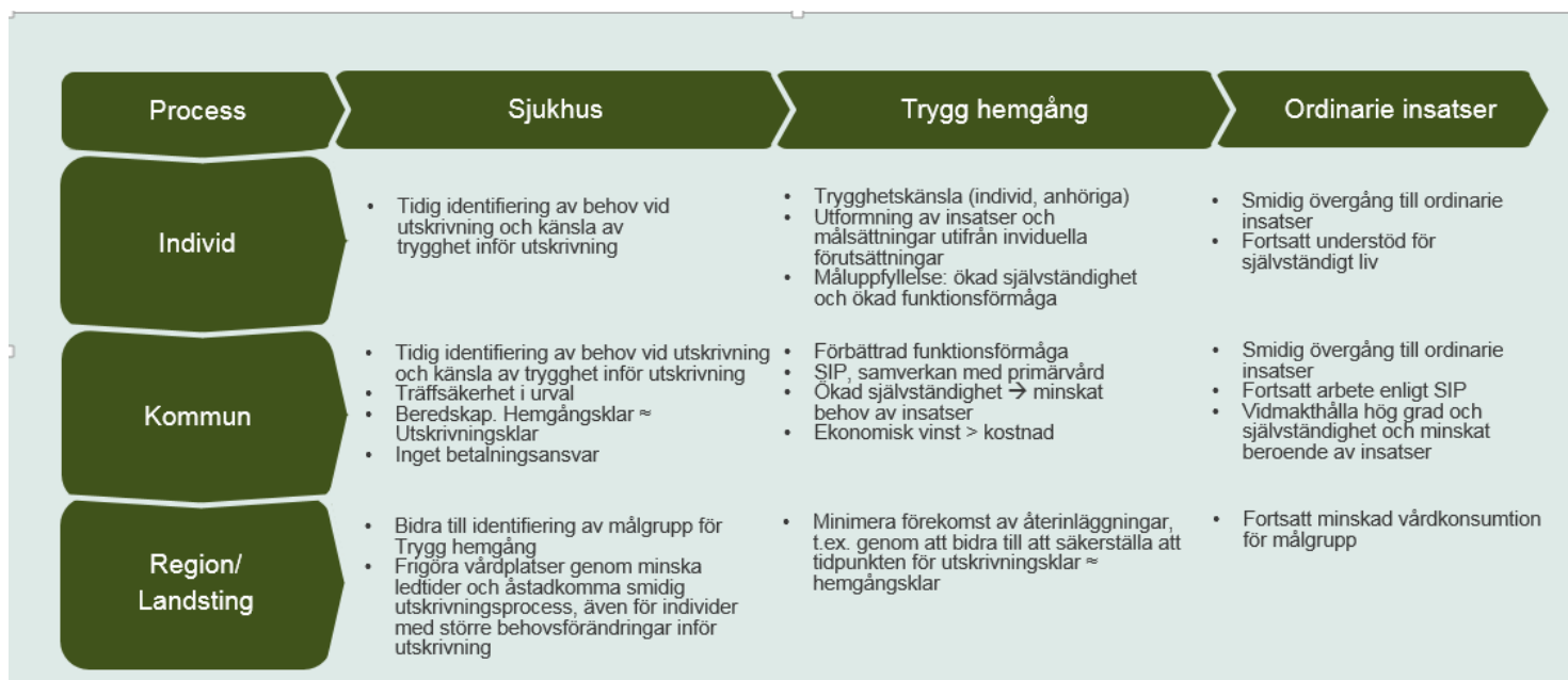
Figur 4. Exempel på mål utifrån olika perspektiv och var i processen målet lämpar sig.

Slutenvårdstillfället, utskrivningsprocessen och Trygg hemgång är en komplex serie av händelser. Flera aktörer är involverade och det slutliga resultatet är i hög utsträckning beroende av hur väl samspelet mellan aktörerna fungerar. I förenklad form kan processen beskrivas enligt nedan. Trygg hemgång tar vid under en tidsbegränsad period efter utskrivning från slutenvård. Därefter lämnar Trygg hemgång över till kommunens ordinarie omsorgsinsatser, till exempel hemtjänst och hemsjukvård om det finns behov av vård- och omsorgsinsatser fortsättningsvis. Figuren nedan visar exempel på mål utifrån olika perspektiv och var i processen målen lämpar sig (figur 4).