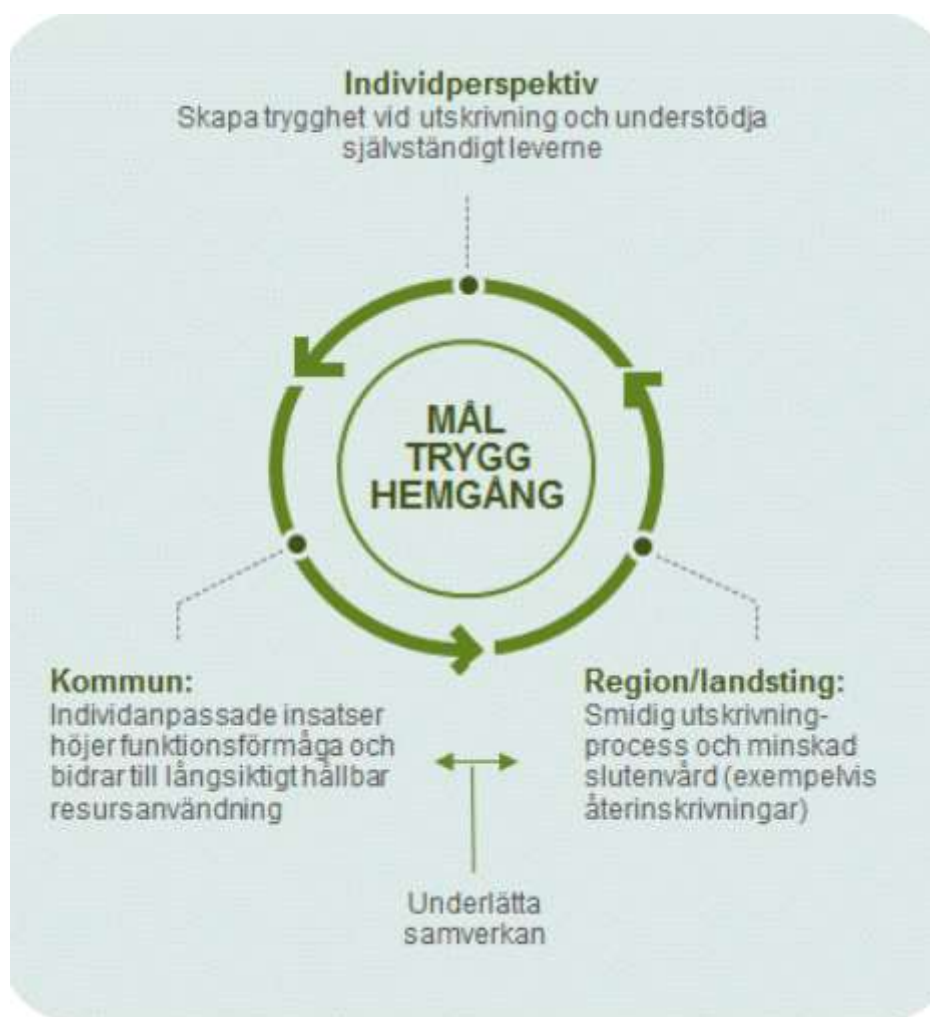
Figur 3. Målsättningar för Trygg hemgång från olika perspektiv

Det kan finnas fler målsättningar med Trygg hemgång som kommer från olika perspektiv. Utöver individperspektivet är huvudmännens perspektiv centrala. Det handlar om kommunen och landstinget/regionen och deras respektive verksamheter (figur 3).