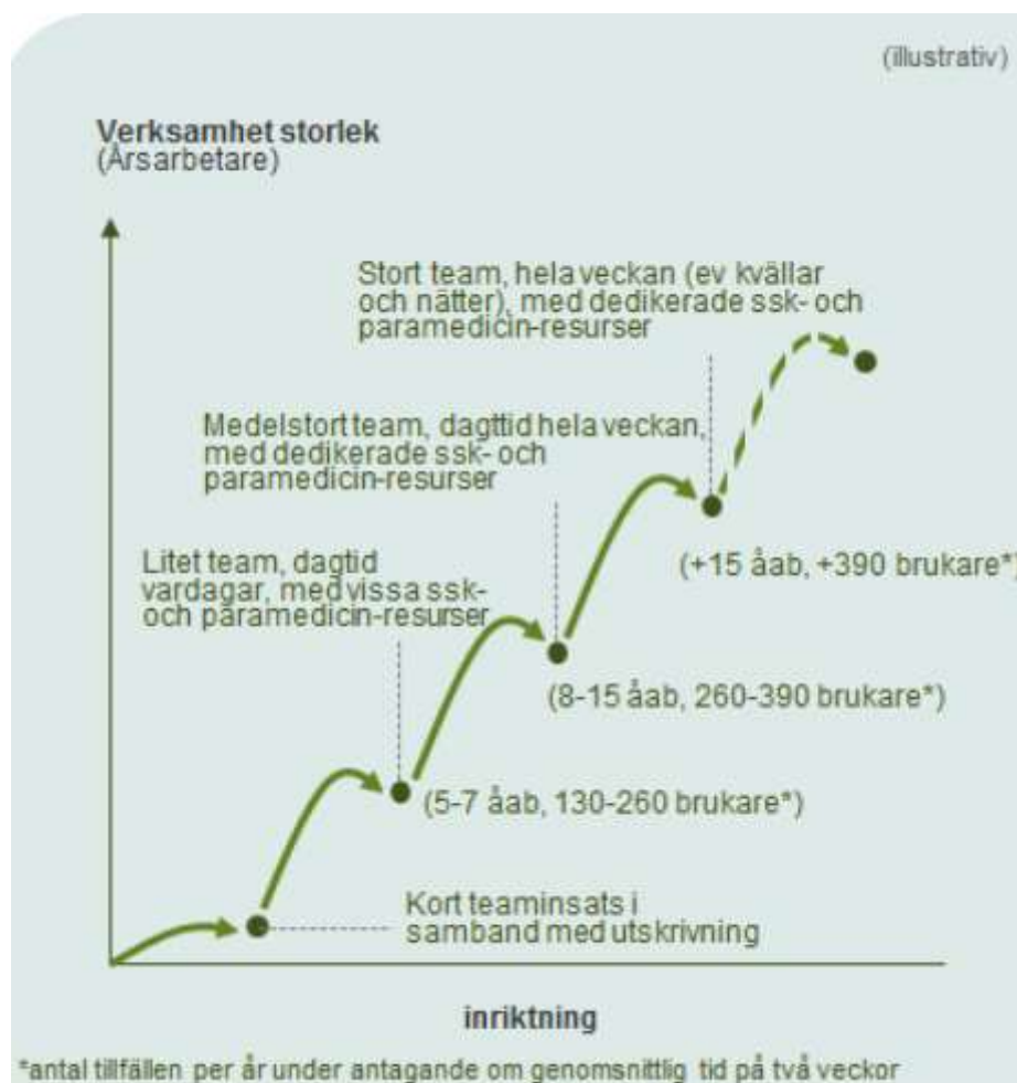
Figur 6. Teamens storlek och kapacitet kan variera. Siffrorna är grova uppskattningar och varierar med exempelvis vårdtyngd och hur urvalet definieras.

Figur 6 ger ett exempel på hur kapaciteten (det vill säga det årliga antalet brukare) per år för Trygg hemgång kan beräknas beroende på teamstorleken och den genomsnittliga längden på tjänsten. Exempelvis vore 260-390 brukare per år en relevant omfattning för ett medelstort team där tjänstens genomsnittliga längd är cirka två veckor. Figuren ger endast en riktgivande uppskattning och mer exakt bedömning kan göras med detaljerad information om teamets sammansättning och insatserna intensitet.